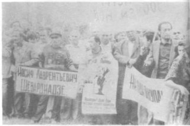
На сходе в селе Лыхны 20 июня 1993 г.