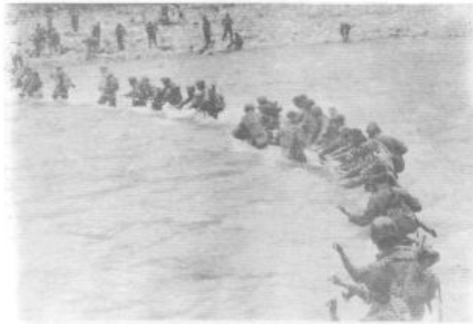
Переправа через бурную Гумисту. Так начиналась Шромская операция в июле 1993 г.