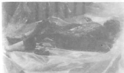
Этот человек тоже мечтал жить, любить... Одна из жертв, сгоревших в вертолете с беженцами из Ткуарчала, который был сбит 14 декабря 1992 г. над селом Лата.