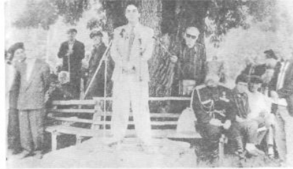
Выступление на сходе Владислава Ардзинба