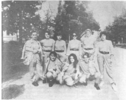
Бойцы абхазского женского батальона.