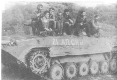
Экипаж легендарного танка "01" абхазской армии, отбитого у противника в бою у Красного моста в Сухуме 14 августа 1992 г.