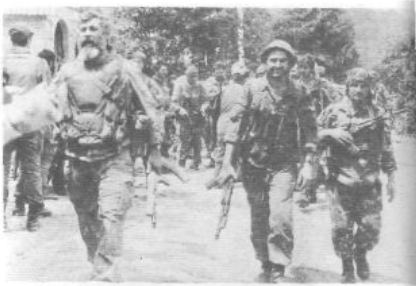
15 июля 1993 г. Они уходят в бой за село Цугуровка.