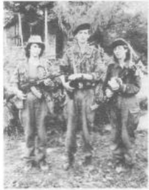
В час смертельной опасности для Родины взяли в руки оружие и девушки.