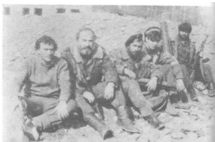
Они сражались за Родину.