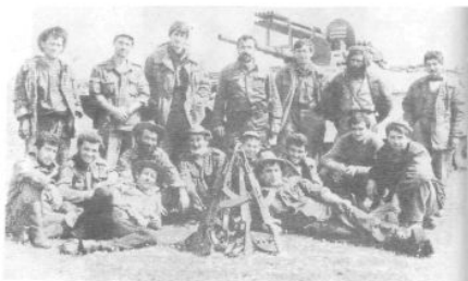
На учебном полигоне.