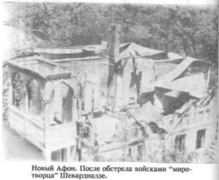
Новый Афон. После обстрела войсками "миротворца" Шеварднадзе.