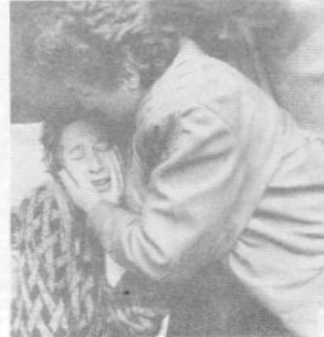
Если б слезы всех матерей Абхазии собрали воедино, в них захлебнулся бы развязавший эту войну.