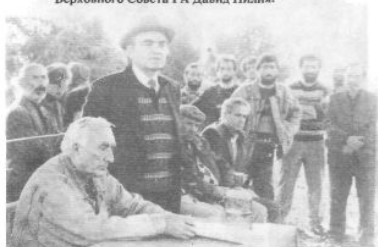
Президенту Конфедерации народов Кавказа Муса Шанибов выступает на встрече с жителями села Отхара Гудаутского района.