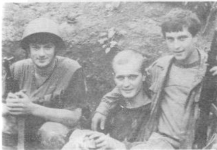
Вчера они сидели за школьной партой...