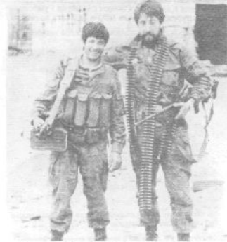
Фронтное братство. На Гумистинском фронте.