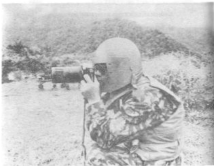
Пелегка на войне работа фотожурналиста.