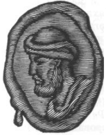
Печать Михаила Темрюковича Черкасского с его изображением

В числе более чем 1200 имен казенных бояр и воевод, дворян, детей боярских и приказных дьяков в нем назван и «Черкасский князь Михайло Темрюкович».