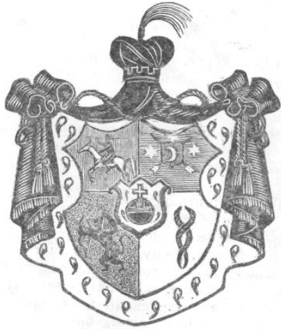
Родовой герб Черкасских. Утвержден в 1798 году