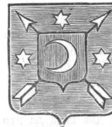
Герб Кабардинской земли