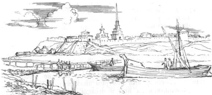
Казань. Через этот город лежал путь по Волге с Северного Кавказа к Москве. Отсюда не раз отправлялись и в Кабарду отряды русских ратников для борьбы с ее врагами. С рисунка XVII века

спешил и, несмотря на советы переждать зиму, двинулся дальше. Проваливаясь по брюхо в снег, обдирая до крови об острый снежный наст ноги, измученные и взмыленные кони с трудом продвигались вперед по снежной целине. Потом от бескормицы начался их падеж. Пробившись по снегу две сотни верст и видя невозможность дальнейшего пути, посол решил вернуться в Казань.