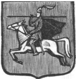
Герб рода Черкасских и горских князей

Как глава Иноземного приказа он многократно вел переговоры с представителями других стран, отдавая все же какое-то предпочтение, видимо, восточным, связанным в той или иной мере с его родиной - Кавказом. В мае 1625 года Черкасский принимал персидского посла - это первое упоминание в источниках о его дипломатических