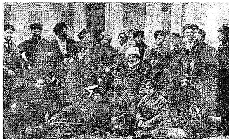
Состав 1-го исполкома Карачая. Апрель 1921 г.

развивающегося бандитизма, таковая помощь со стороны областных органов власти не была оказана. Молодой окружный орган, в попытках своими силами справиться с этим злом, при ограниченности его материальных и финансовых возможностей, встречал большие затруднения. Кроме этого, нужно заметить, что, образовавшаяся окружная власть Карачая, признанная Тер. окр. исполкомом, не признавалась бывшим центром Карачая—Кубанской областью. В частности, Баталпашинская отдельская власть, в состав которой ранее