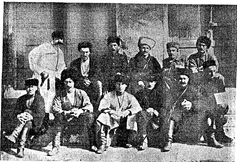
Карачаевская делегация на учредительном съезде Горской республики.