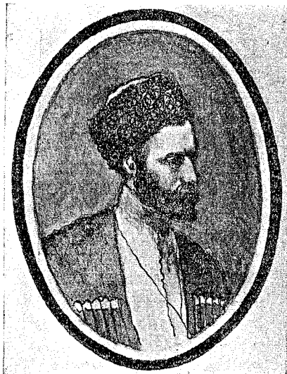
Саид Халилов, коммунист, член президиума Карисполкома, убитый из-за угла в 1921 г. в Теберде.

В первых числах апреля 1921 г., в г. Кисловодске был созван 1-й съезд советов Карачая, на котором разрешился ряд вопросов, имевших большое значение в жизни Карачая; в повестку дня было поставлено 10 вопросов, в том числе такие важные и острые вопросы, как земельные вопросы, борьба с бандитизмом, урегулирование межнациональных отношений с соседями, продовольственный вопрос, хозяйственные вопросы, культурные вопросы и др.; над всеми этими вопросами доминировал вопрос земельный. На съезде