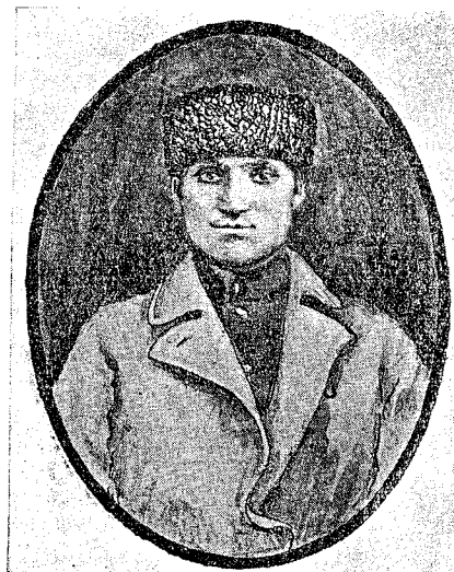
Таукан Алиев, убитый бандитами в мае 1920 г. во время служебной командировки.