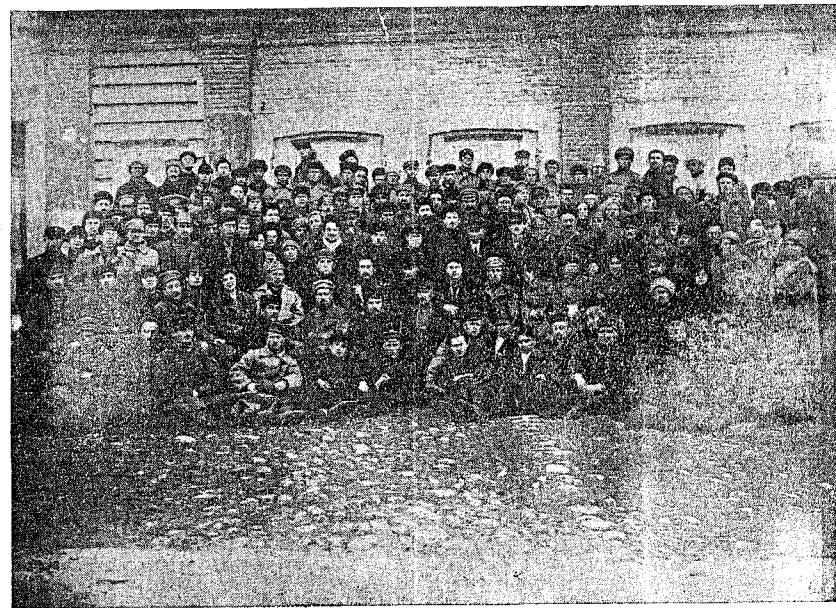
Учредительный с'езд Горской республики.

И эти разбойничьи шайки, агенты барона Врангеля, во главе с Султан-Келич-Гиреем и Мурзакулом Крымшамхаловым после полного разорения, ограбления страны, погнав впереди себя награбленные табуны и прочий скот по Военно-Сухумской дороге в Грузию, постарались и сами удрать туда до покрытия перевала снегом и т. д.