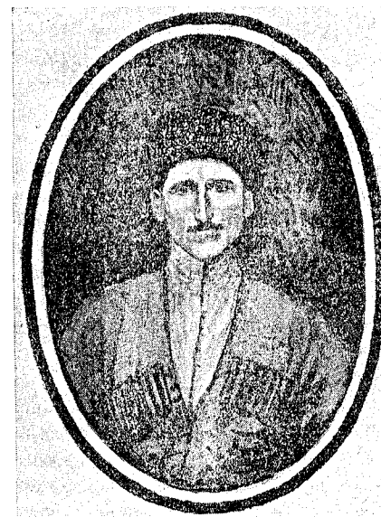
Канамат Халкечев, председатель Мало-Карачаевского райисполкома, убитый бандитами в ауле Кумско-Лоовском в 1921 г.

Для иллюстрации состояния тогдашнего бандитизма в Карачае и принимаемых Карачаевским ревкомом мероприятий, мы приводим текстуально докладную записку окр. Чека по борьбе с бандитизмом в Карачае, председателем которой тогда был (председатель Карачаевского обл. исполкома в 1926 г.) т. Батчаев (представленную им 13 августа 1921 г.).